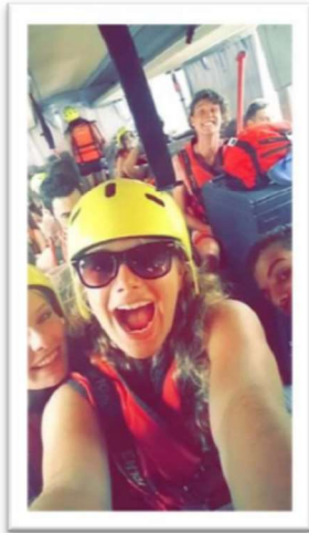
In de bus, op weg naar het raften

moet laten komen, ik heb me ontzettend geïnteresseerd in de Turkse mensen die ik heb ontmoet en ik kreeg er veel voor terug. Een fantastische tijd.