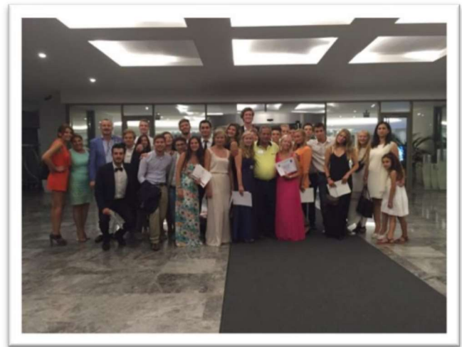
Laatste avond van het kamp: Gala