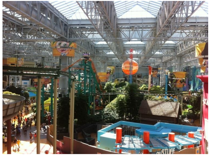
Mall Of America