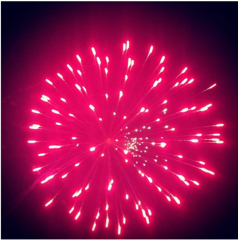
4th of July