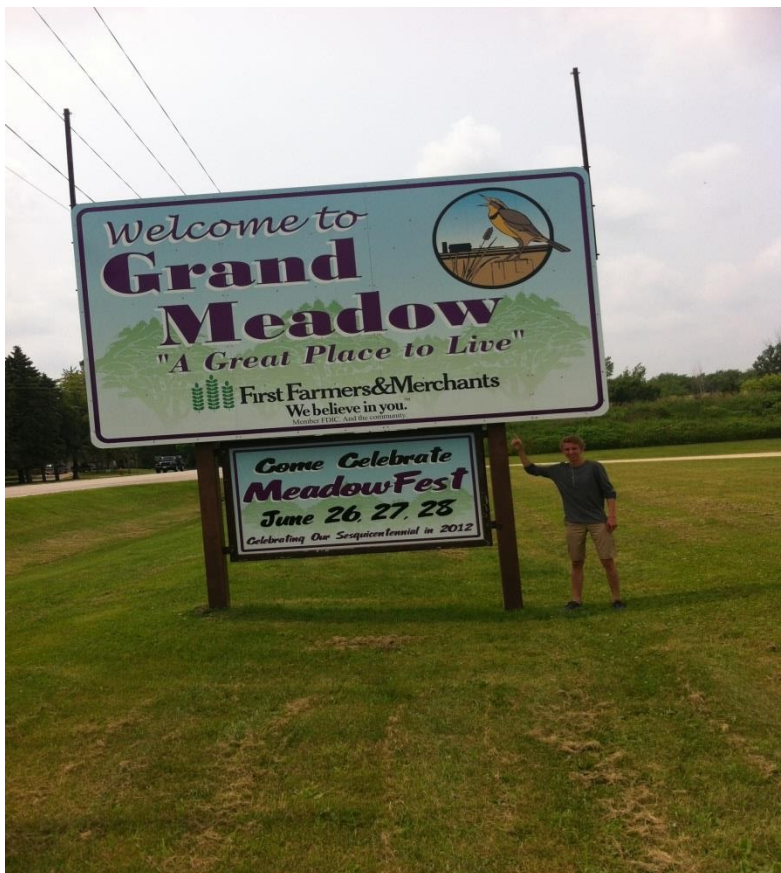
Bij het welkom in Grand Meadow bord