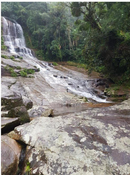
Een vlugge blik in de Braziliaanse natuur