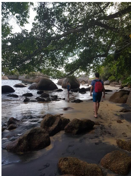
Op een onbewoond eiland..