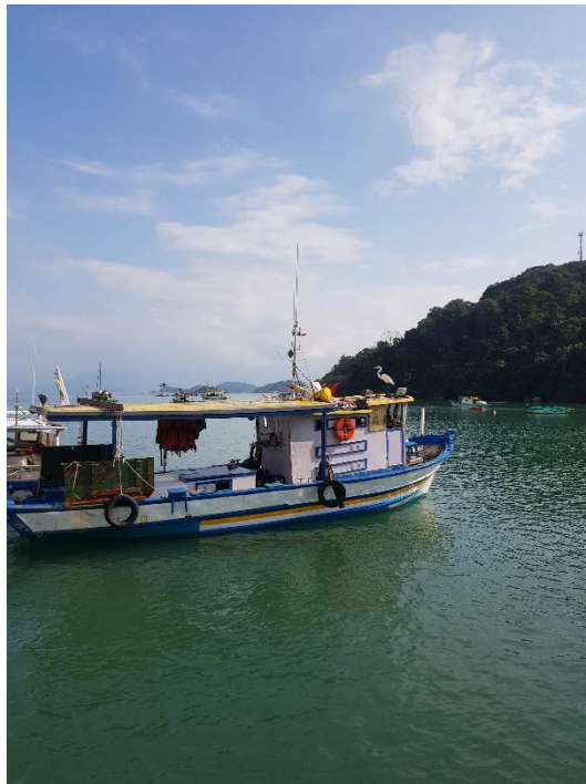
Op weg naar Paraty, maar eerst een tussenstop!